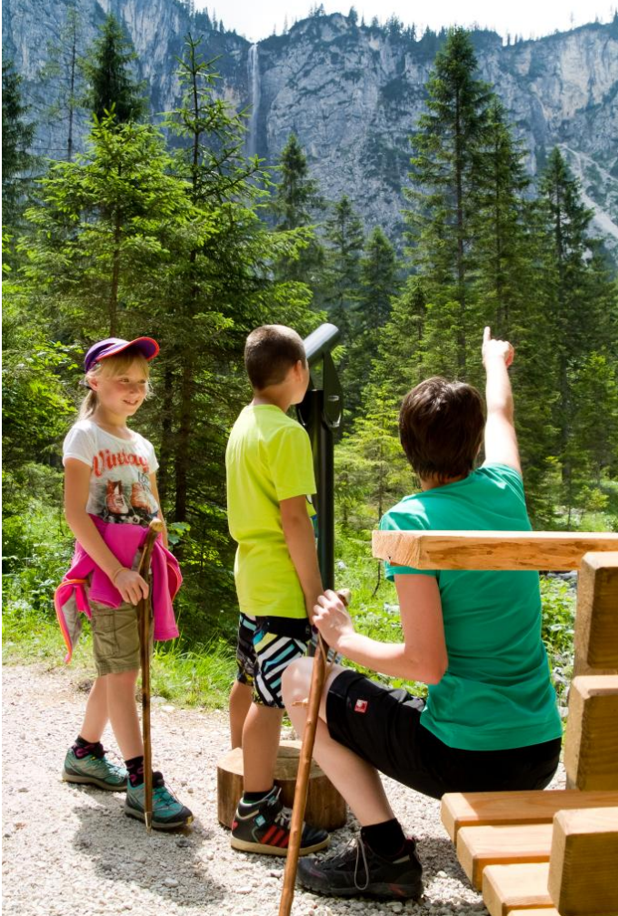
Autor Sandra Bader Quelle Foto Somweber