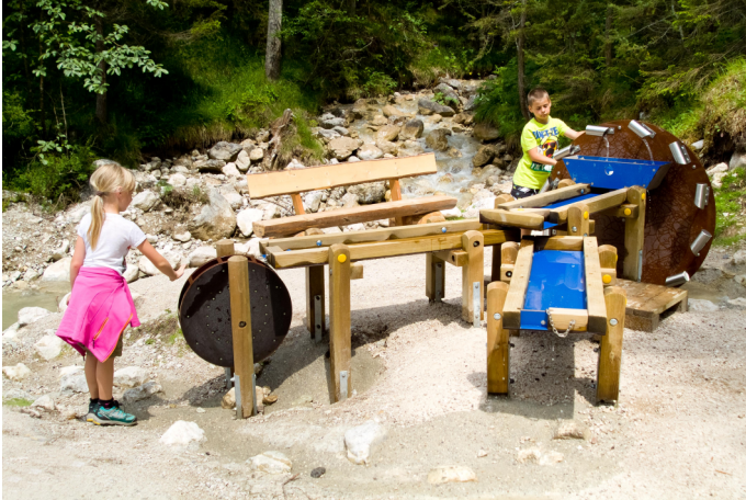
Autor Sandra Bader Quelle Foto Somweber