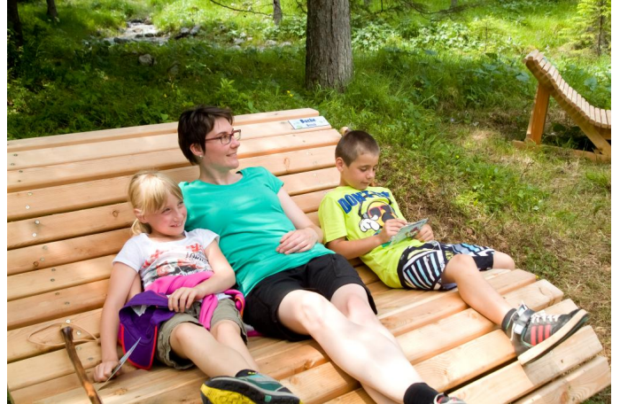
Autor Sandra Bader Quelle Foto Somweber