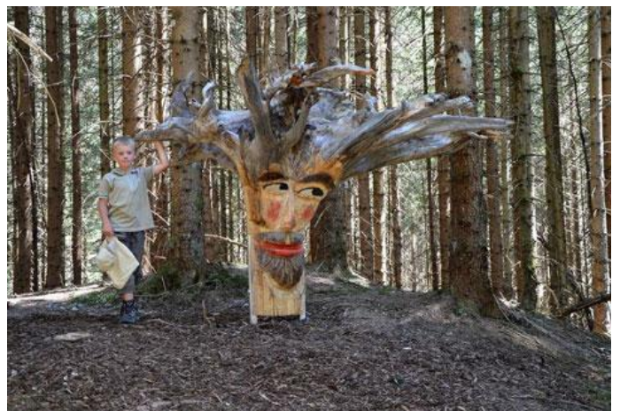
Autor Sandra Bader Quelle Tourismusverband Tiroler Zugspitz Arena